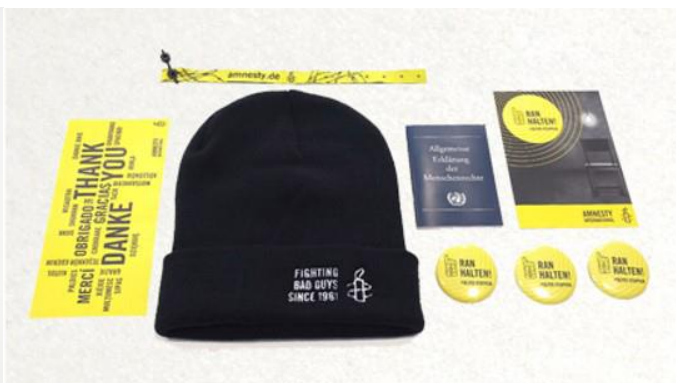
Amnesty International: RANHALTEN für die Menschenrechte