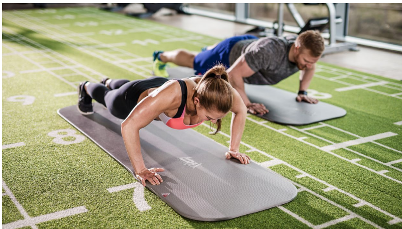
Digitale Trainingsmatte mit integrierter NFC-Technologie