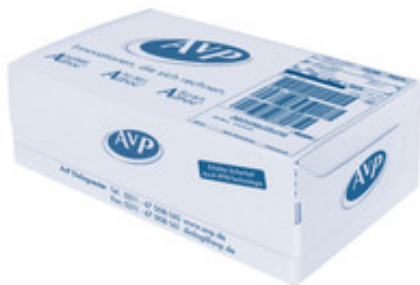
AvP-Rezeptbox mit RFID-Technologie von smart-TEC

Nach der Verarbeitung in den AvP-Rechenzentren werden die Rezeptboxen zu den jeweiligen Kostenträgern versandt, die ihrer Archivierungspflicht nachkommen. Die Abrechnung von Rezepten im Gesundheitswesen, wird somit durch den Einsatz von RFID-Technologie, einfacher, sicherer und schneller.