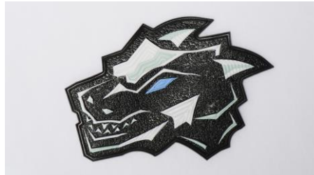
smart-FLEXXLINE individuelle Gestaltungsmöglichkeiten