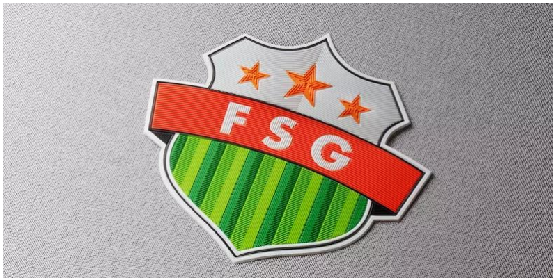
smart-FLEXXLINE im Sportbereich